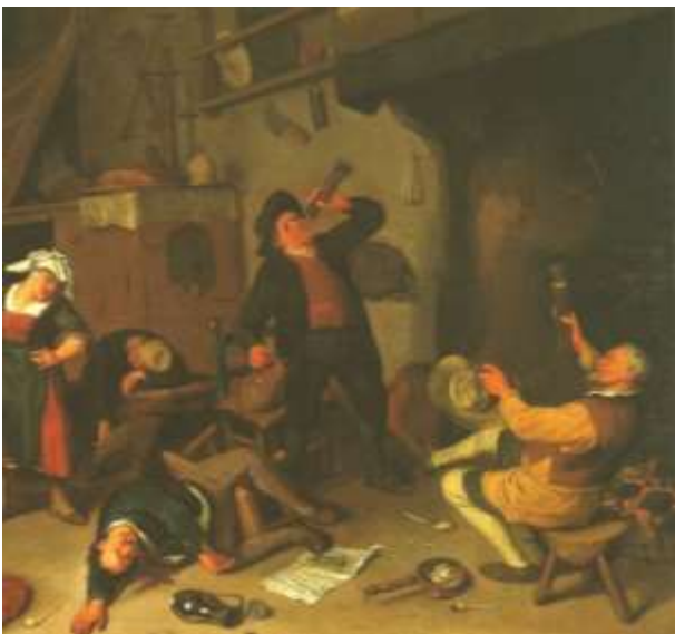
Een dorpsherberg omstreeks 1700. Schilderij van Cornelis Dusart (1660-1704)

Vrolijke feest- en kermistaferelen zoals in het alom bekende werk van de Brabantse kunstschilder Pieter Bruegel de Oude (ca.1525-1569), houden in de herinnering dat onze voorouders er een uitbundig ontspanningsleven op nahielden.