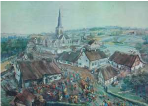
Aquarel door Hubert Deherdt (1978)

Aan de excessen moest natuurlijk een einde worden gesteld, zoniet gaat dit land een landt van duysent debauchen worden.